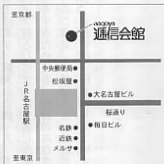
●JR名古屋駅前から北へ徒歩6分。

同窓会開催の案内につきましては、本航友会だよりにより、全卒業生に案内するとともに、現教職員及び、旧教員、非常勤講師の方々へも案内をいた