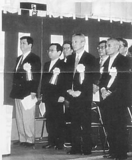
航友会会長（前列左より2人目）

今後とも、航友会会員の方々のご協力の下、会の活動を盛り上げていきたいと思っておりますのでよろしくお願いいたします。